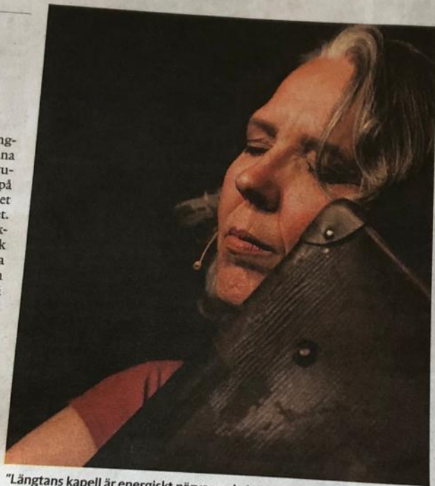
"Långtans kapell är energiskt närvarande i sitt spel och Heikkinens sång är avvägt känslösam", skriver Mikaela Blomqvist.

De finska klassikerna används här som vaggvisa, som festmusik och som sorgesång. Långtans kapell